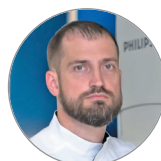
ГКБ святого великомученика Георгия (г. Санкт-Петербург) Оператор: Курьянов П.С.