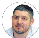
НМИЦ им. В.А. Алмазова (г. Санкт-Петербург) Оператор: Зубарев Д.Д.